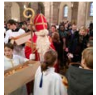
Distribution de männele

'Après-midi Bonheur' Confection de bredele