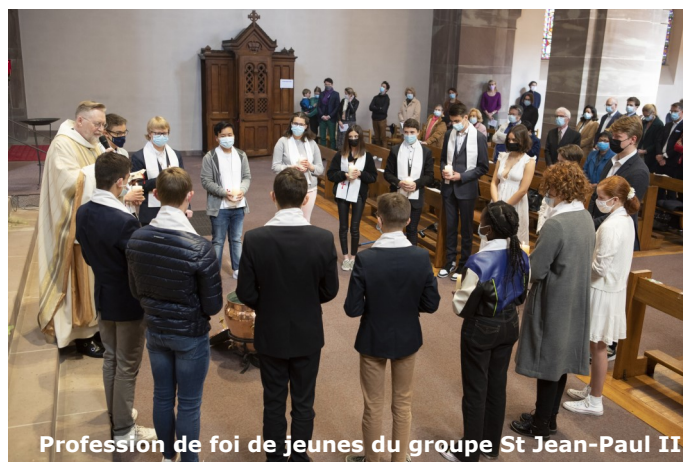
Profession de foi de jeunes du groupe St Jean-Paul II

Le rite de l'eau et de la lumière montre comment la profession de foi rappelle le baptême.