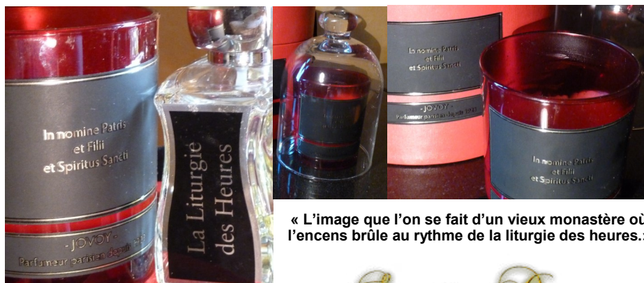
« L'image que l'on se fait d'un vieux monastère où l'encens brûle au rythme de la liturgie des heures. »